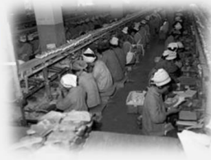
중소기업 공장 내부의 모습 (1964)