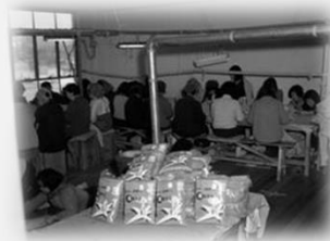
중소기업 공장 내부의 모습 (1964)