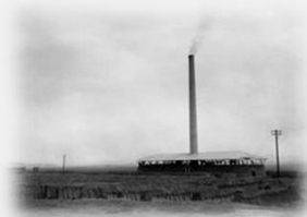
구로동 벽돌공장의 모습 (1964)