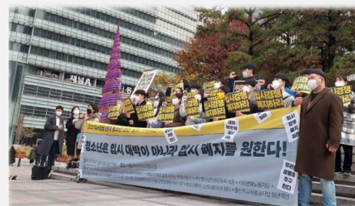
투명가방끈 활동 : 대학 입시 거부 선언