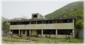
1996년 폐쇄된 동두천의 낙검자 수용소