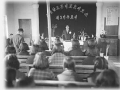
충청남도 부녀보호지도소 제3기 수료식(1964)