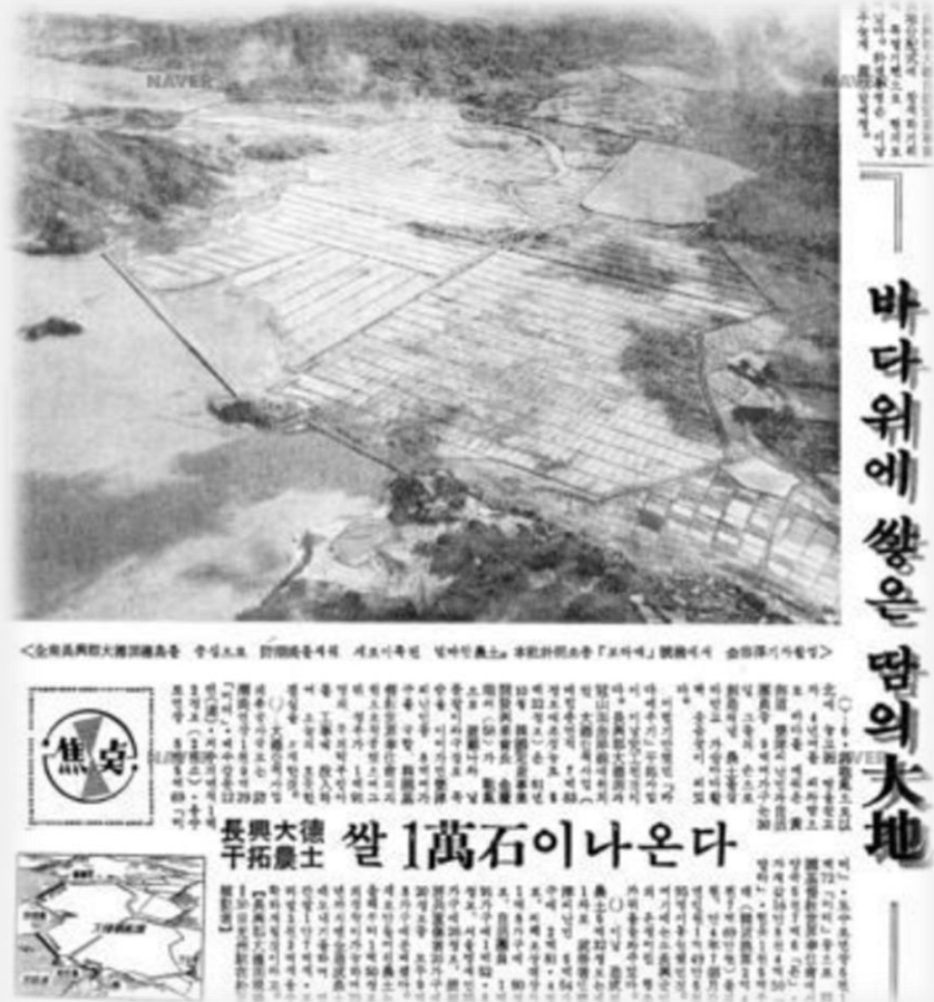
장흥 정착사업 농지의 쌀 생산량 주목한 보도