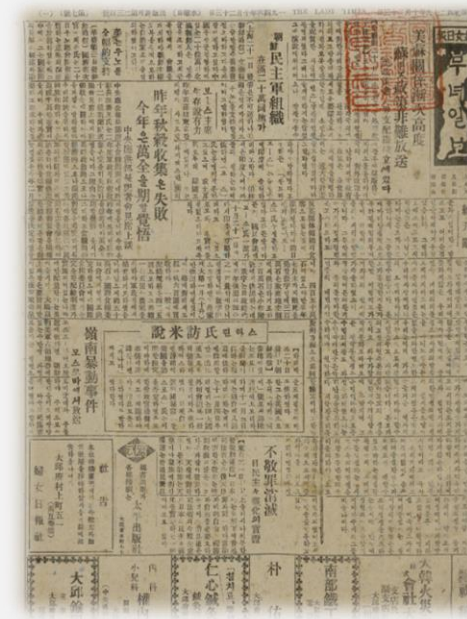
일간지인 <부녀일보> 1946. 10. 23일자