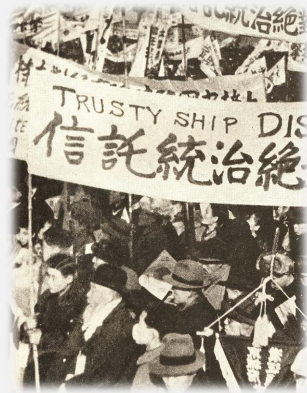
1945년 말 신탁운동 반대운동 집회 모습