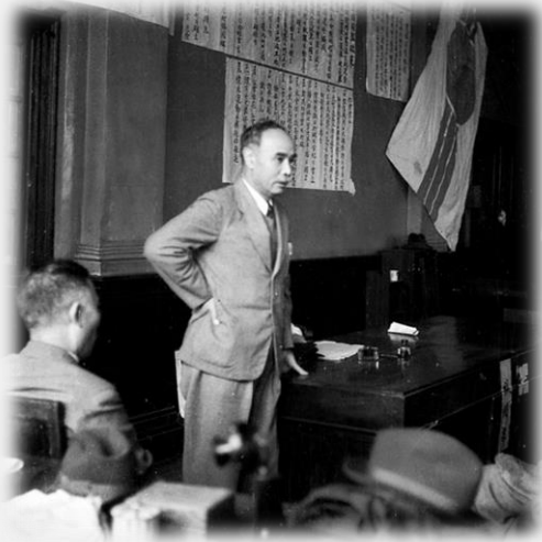
1945년 8월 16일, 건국준비위원회 발족식에서 여운형