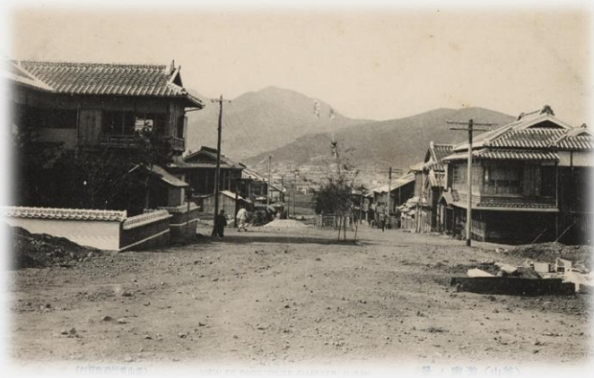
일제강점기 부산 지역의 유곽 지역의 모습을 담은 사진엽서