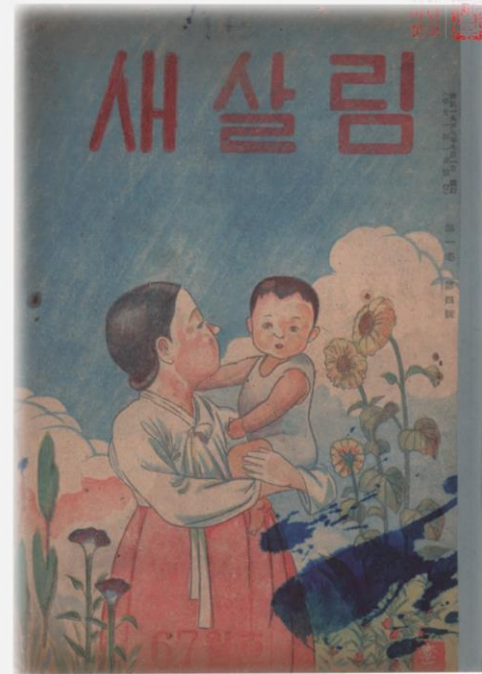
<새살림> 1권 4호 (1947)의 표지