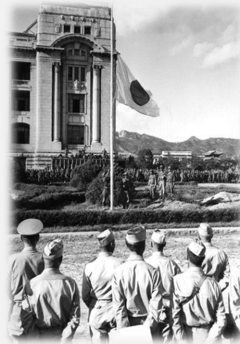
1945년 9월, 미군의 도착으로 총독부 건물 앞 계양대에서 일본기를 내리는 모습