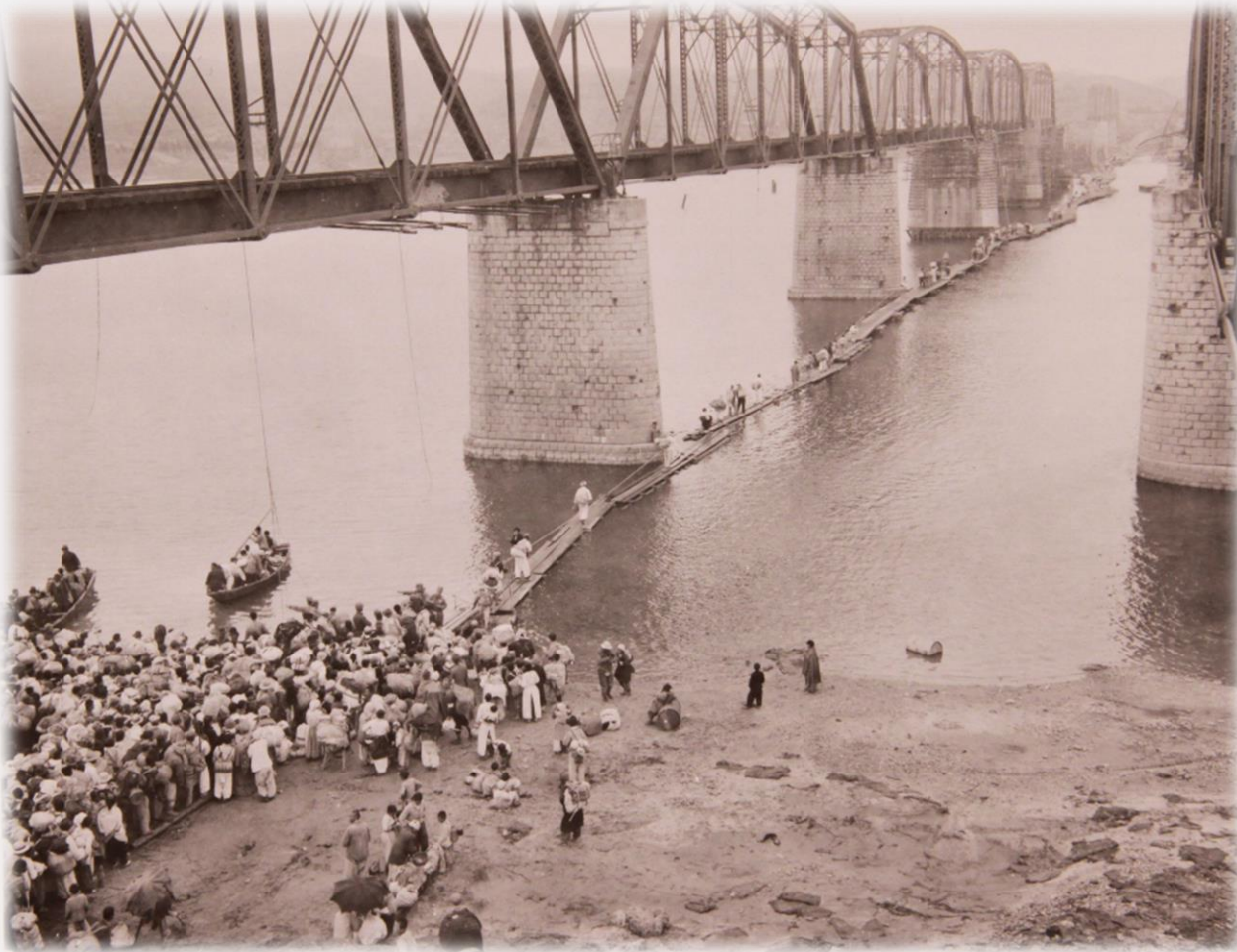
다리 건너는 피난민들