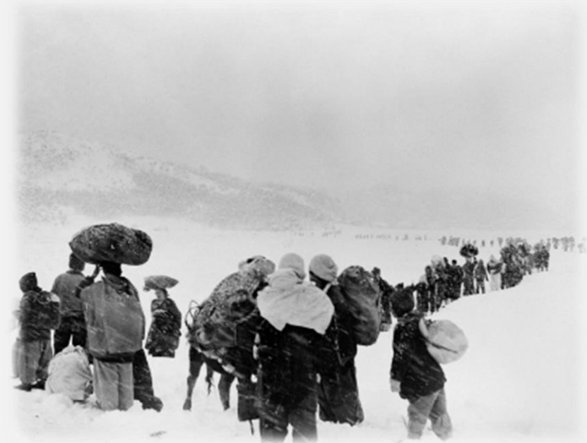
눈을 뚫고 가는 피난민들