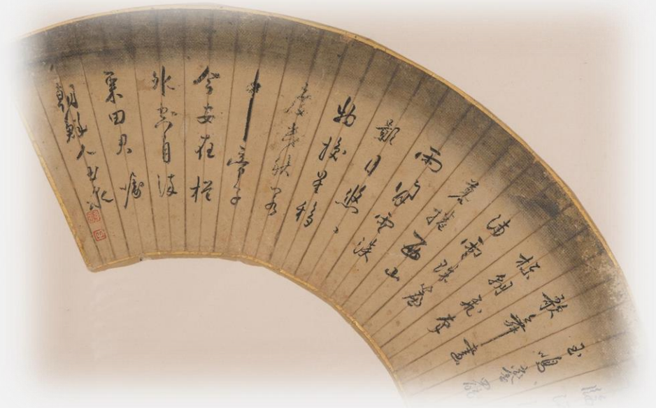
조선통신사 역관 현옥천의 글씨