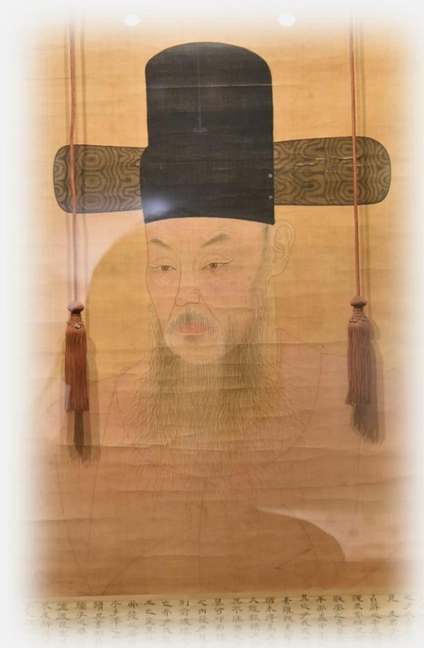
한성부 책임자였던 구택규 초상