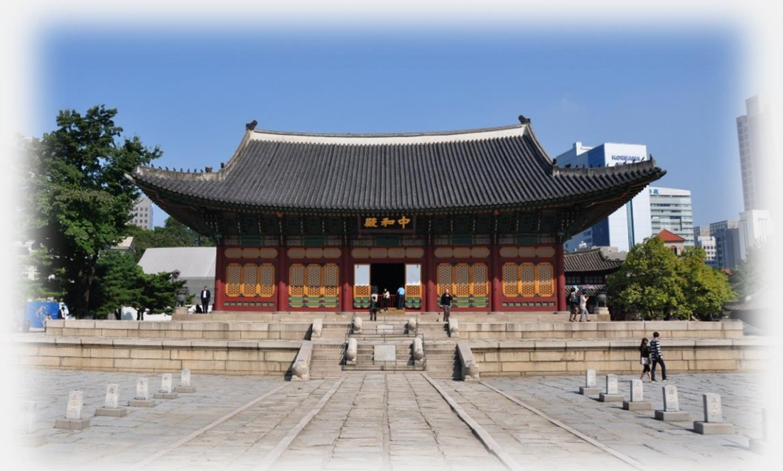
원래 별궁이었던 덕수궁