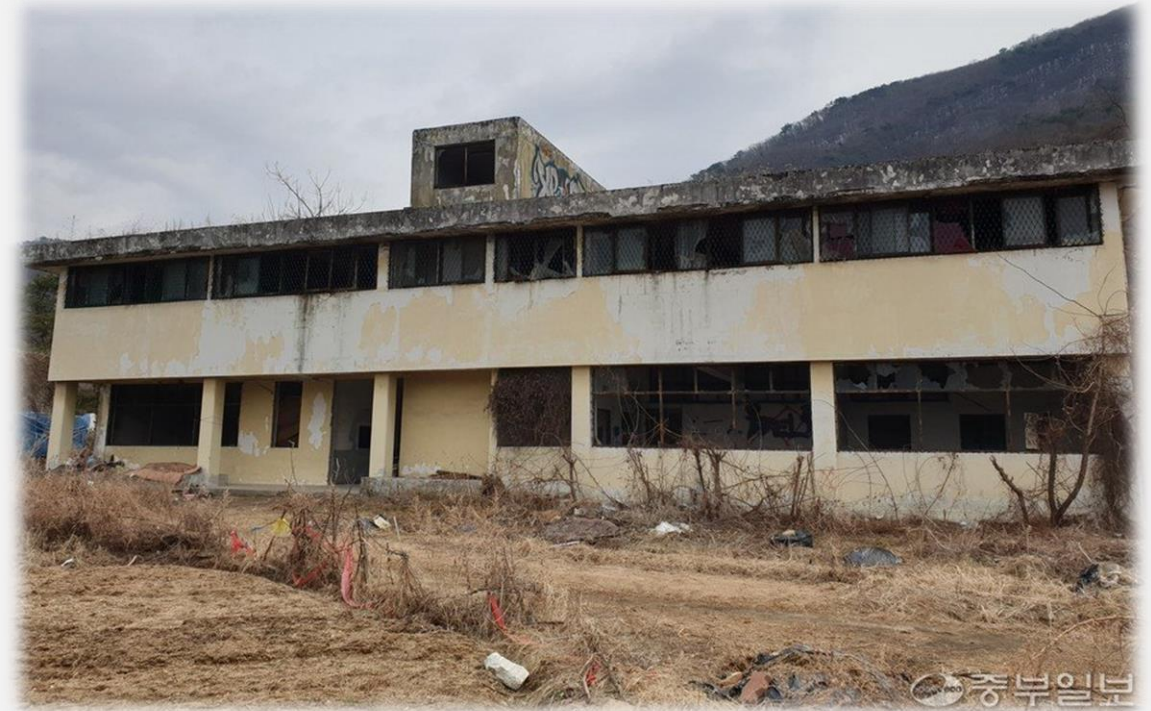
동두천 소재 낙검자 수용소(성병관리소)