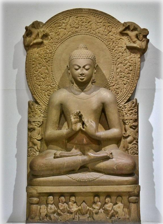
인도 사르나트박물관 석가모니 석상