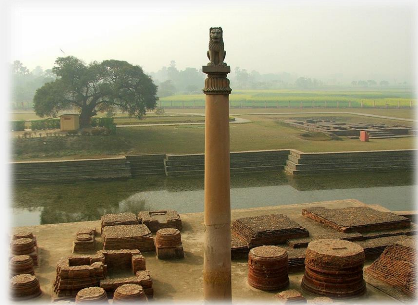
인도 바이샬리 아소카 석주