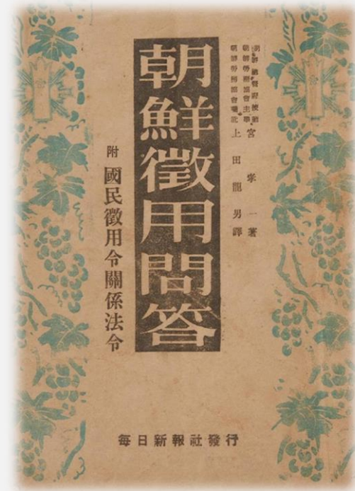
조선인의 징용에 대한 문답식 해설서 《조선징용문답》(매일신보사, 1944.2) 표지