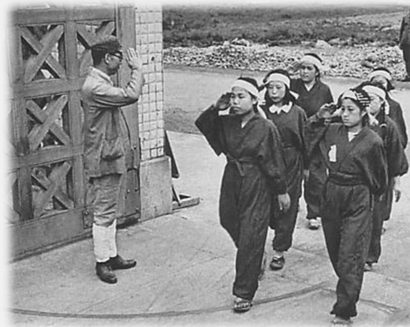
1944년 6월 여자정신대의 모습