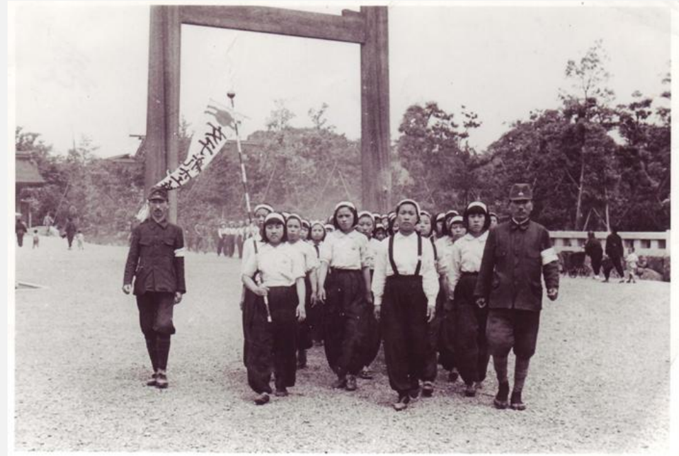
1944년 6월경 일본 미쓰비시 중공업 나오야 항공기 제작소에 동원된 근로정신대 소녀들