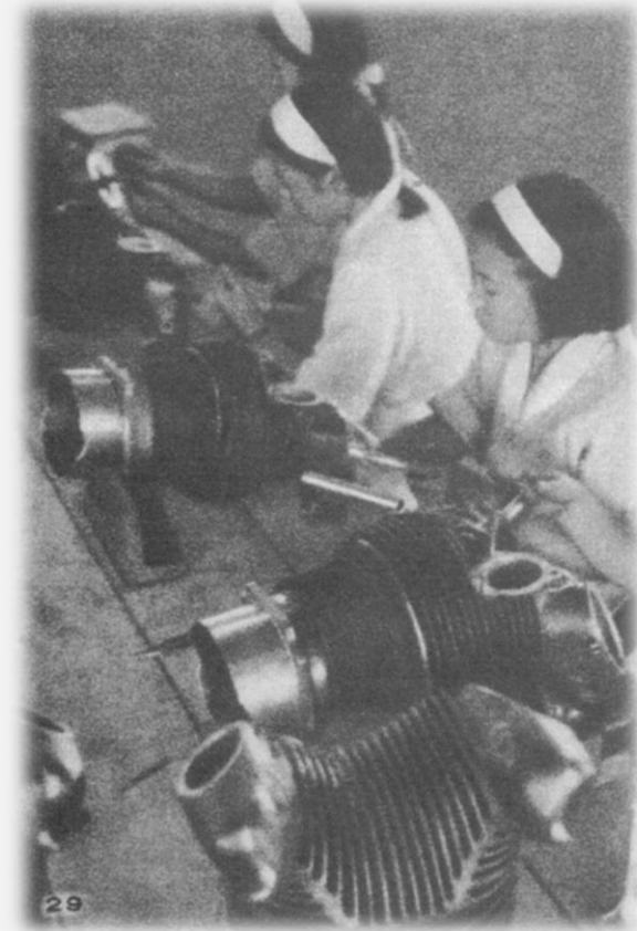
진해 해군항공 조병창에서 일하는 조선여자근로정신대원들