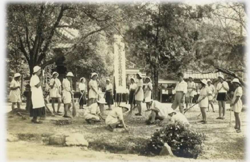
1938년 마산여고 근로보국대의 모습