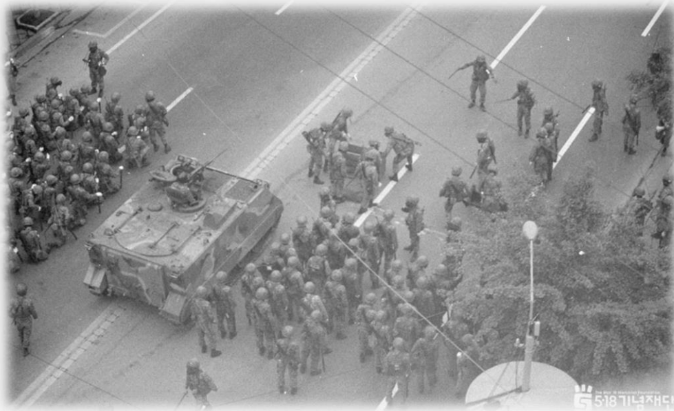
광주에 진주한 계엄군