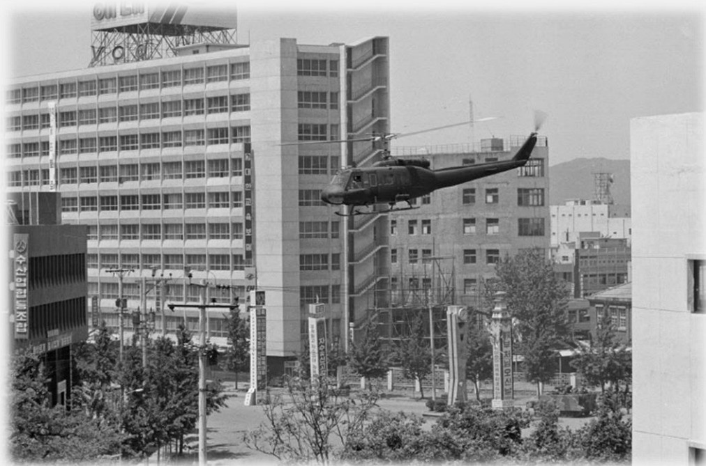
전일빌딩 앞을 돌고 있는 헬기의 모습