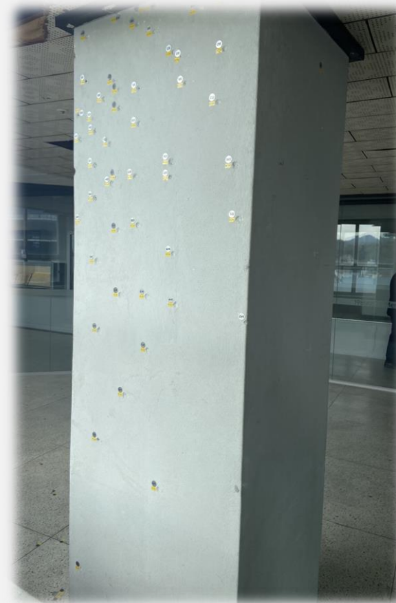
건물 기둥의 총탄 자국