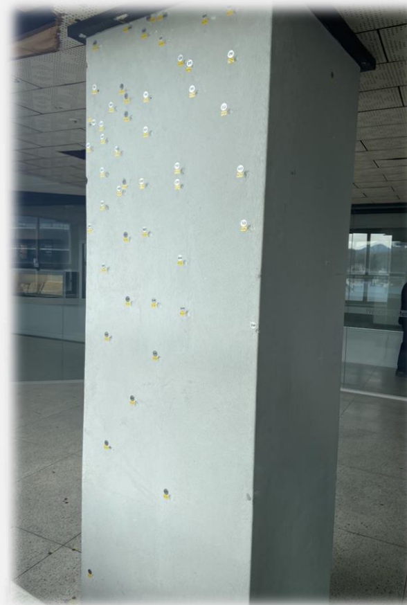
건물 기둥의 총탄 자국