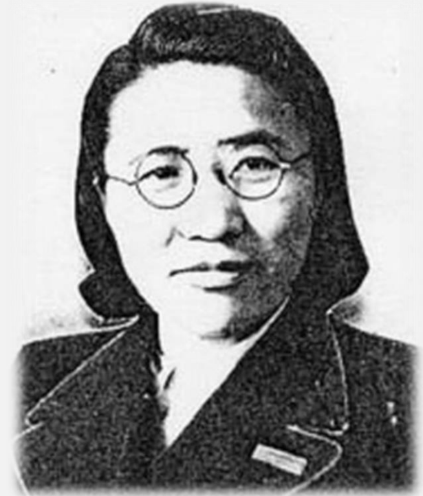
1945년 경의 허정숙