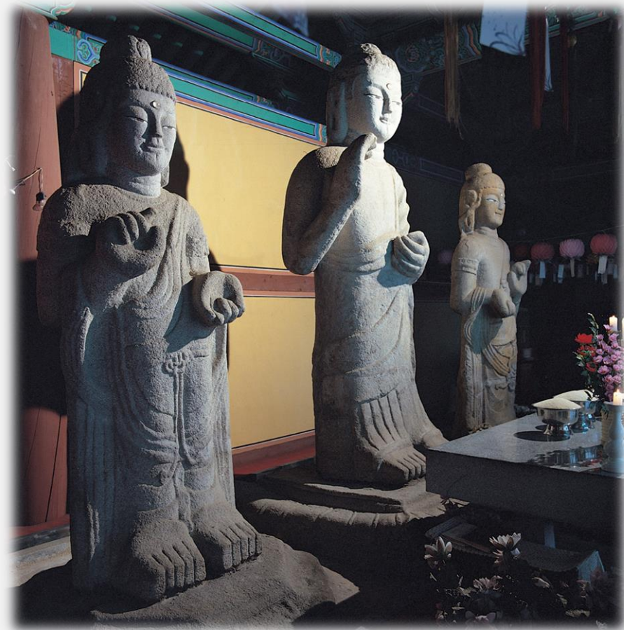
논산 개태사지 석조여래삼존입상