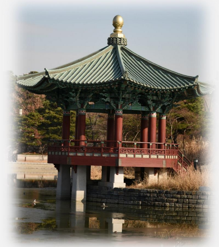
무신정변 당시 국왕인 의종이 만든 청자기와 정자(복원)