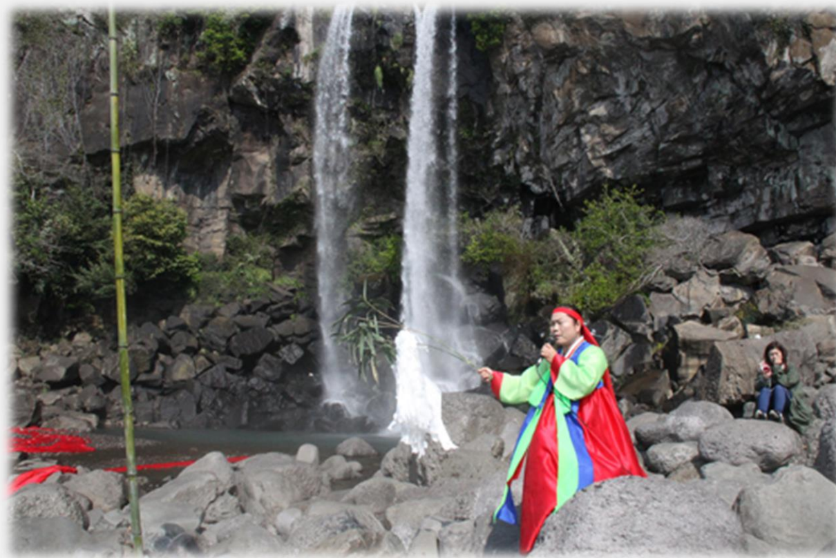
정방폭포에서 억울한 원혼을 달래는 무당