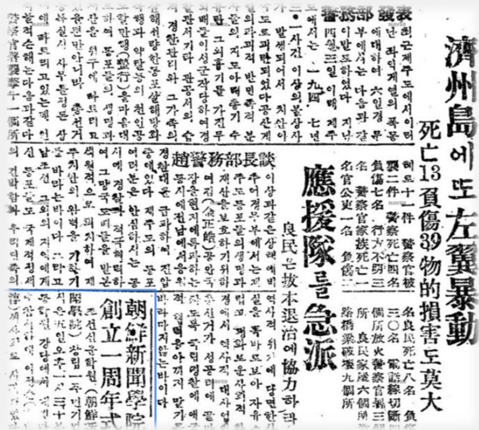
《경향신문》에 보도된 4.3 기사