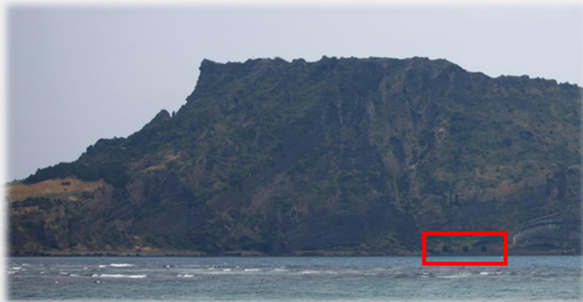
성산일출봉 진지 동굴