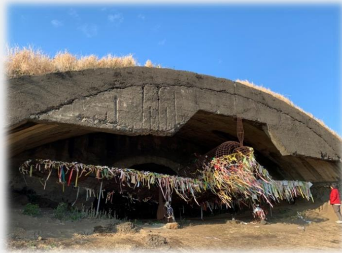
(좌) 알뜨르비행장 (우) 일본군 비행기 격납고