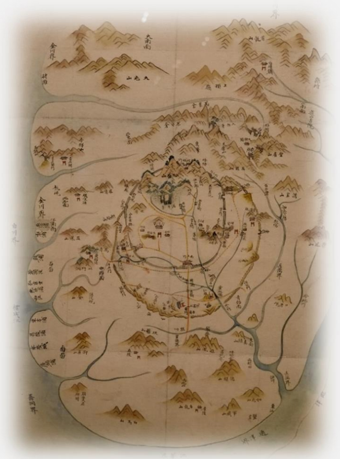
고려의 수도인 개성을 그린 개성전도