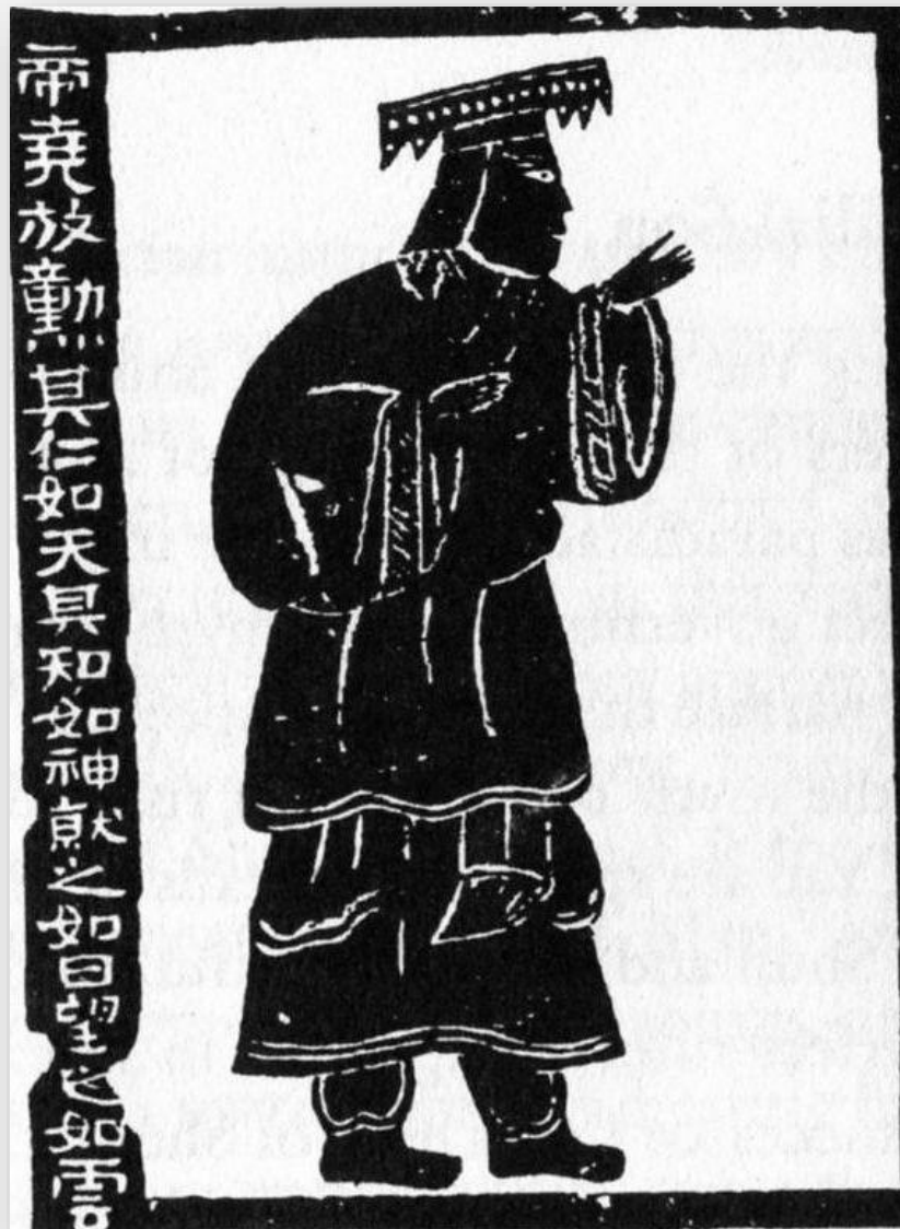
고대의 성왕 제요(帝堯)