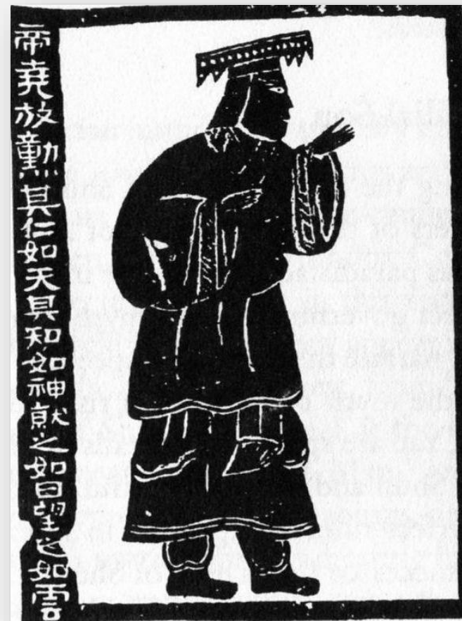
고대의 성왕 제요(帝堯)