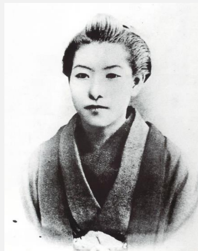
일본 근대여성문학의 선구자 히구치 이치요(樋口一葉)