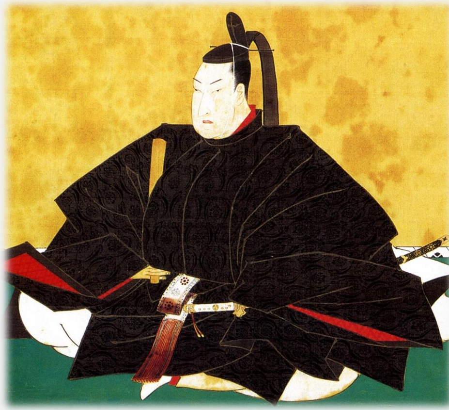
(좌) 나카미카도 천황