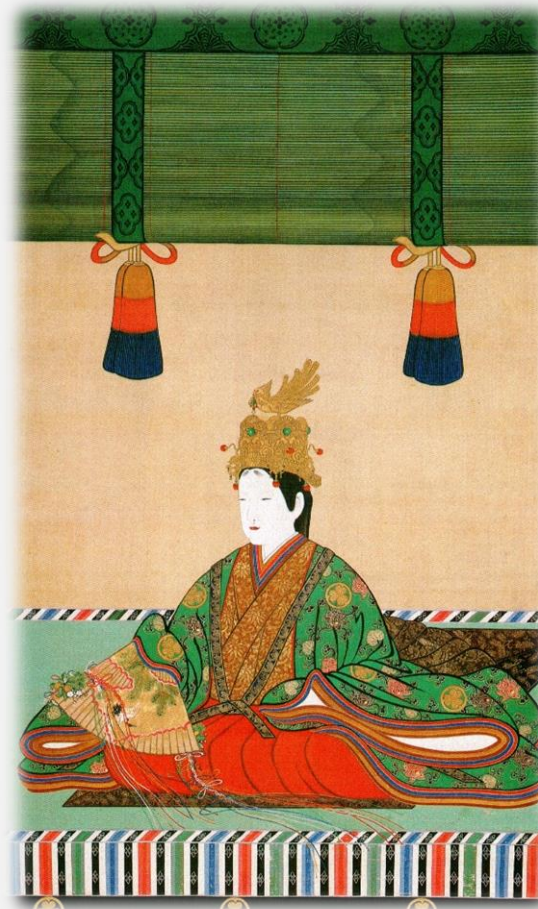
(좌) 고미즈노오 천황