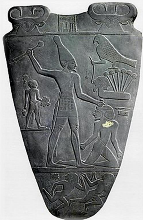
이집트 고왕국 제 1왕조 초대 파라오 나르메르