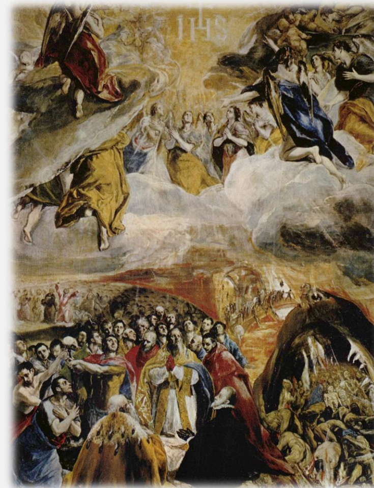
예수라는 이름에 대한 경배