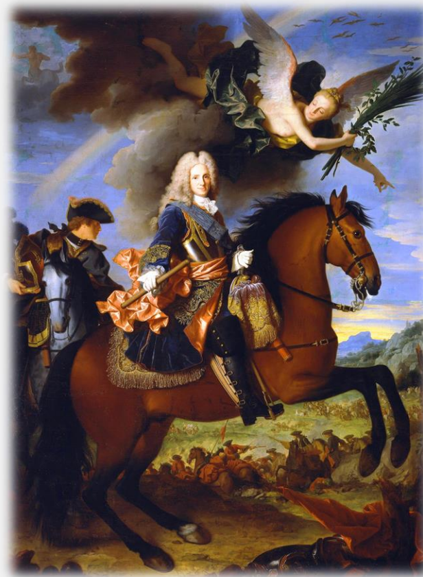
(좌) 펠리페 4세