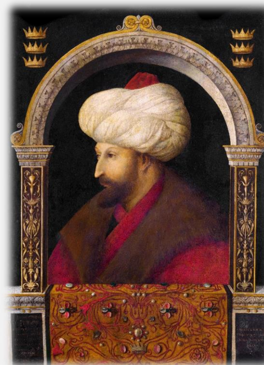
술탄 마흐메드 2세