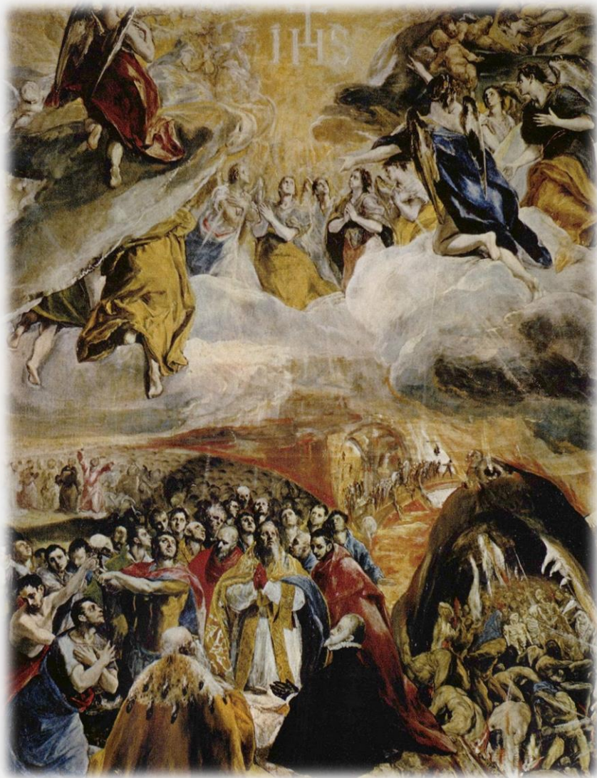
예수라는 이름에 대한 경배