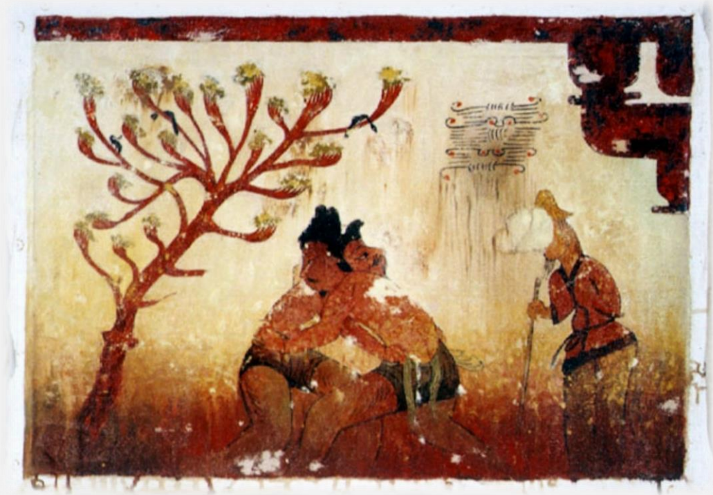
정기화 필 각저총 각저도