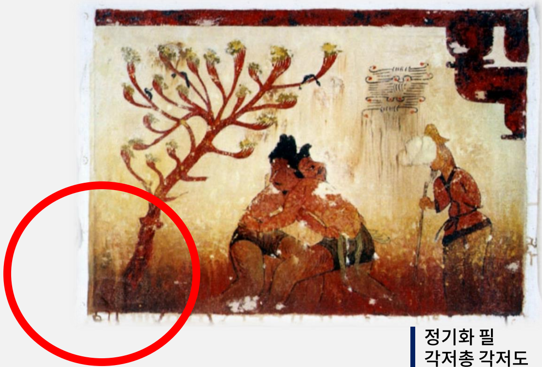
정기화 필 각저총 각저도