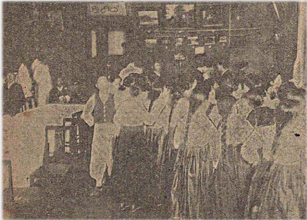
성황리에 개최된 나혜석 전시회