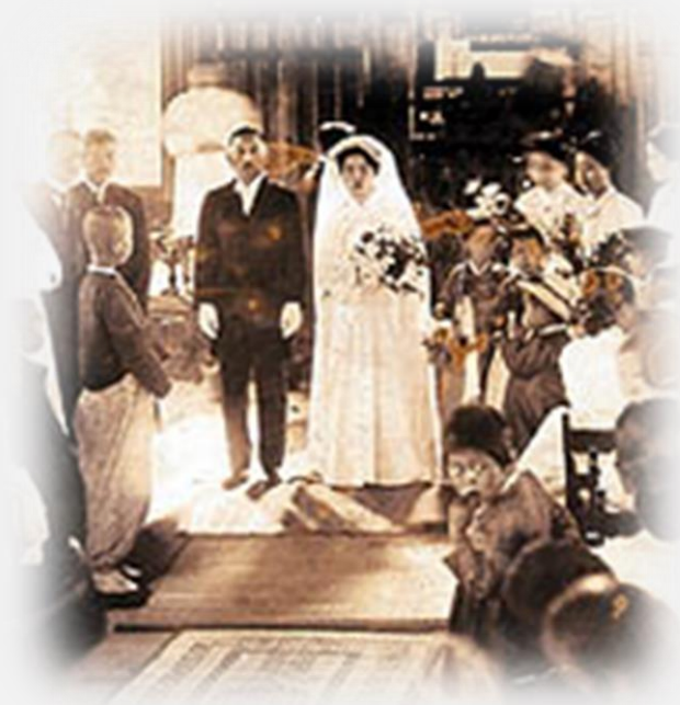
정동교회 나혜석 결혼식 사진