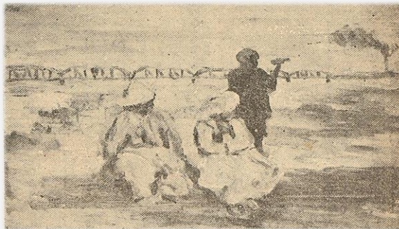
《경성일보》에 실린 그림