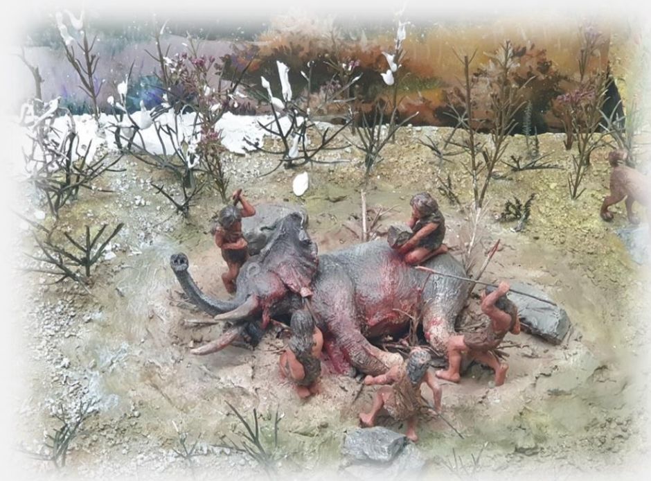
원시인의 사냥 모습 복원