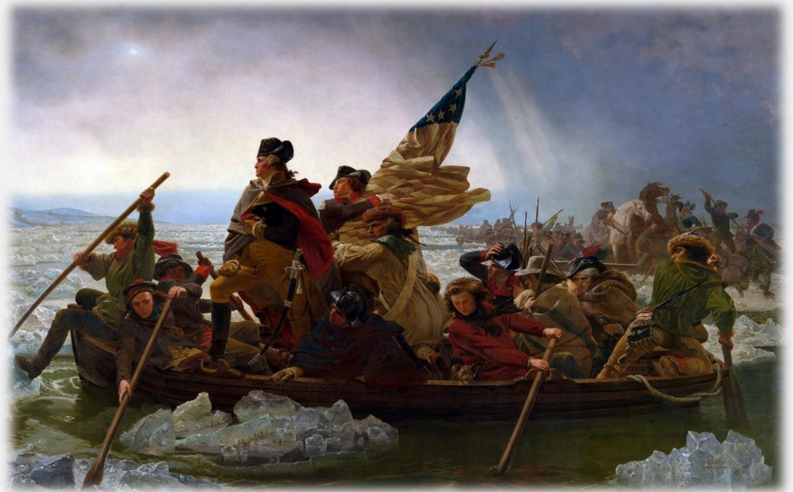
델리웨어 강을 건너는 워싱턴