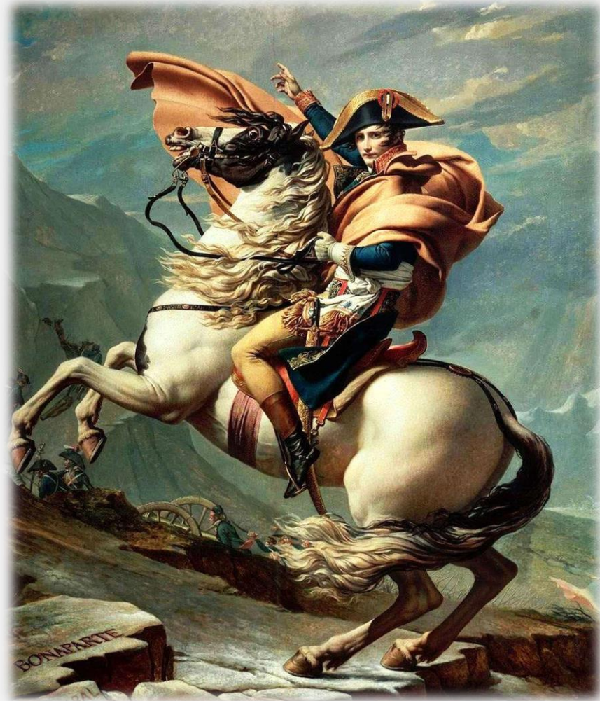
알프스를 넘고 있는 나폴레옹