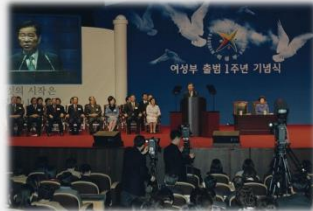
여성부 출범 1주년 기념식 (2002)