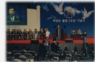
여성부 출범 1주년 기념식 (2002)